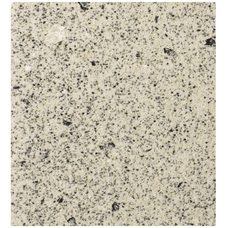
30203 Denali 2012