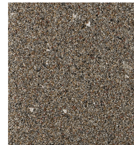
30204 Acadia 2012