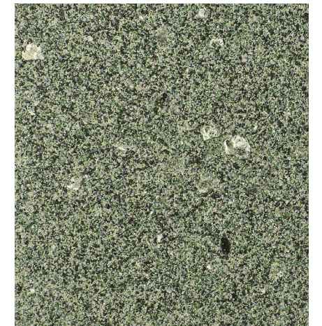
30202 Saguro 2012