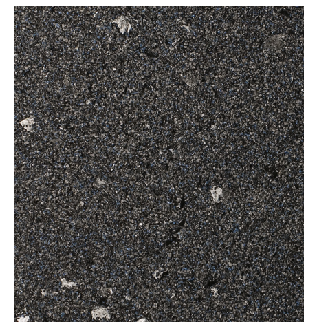
30208 Shasta 2012