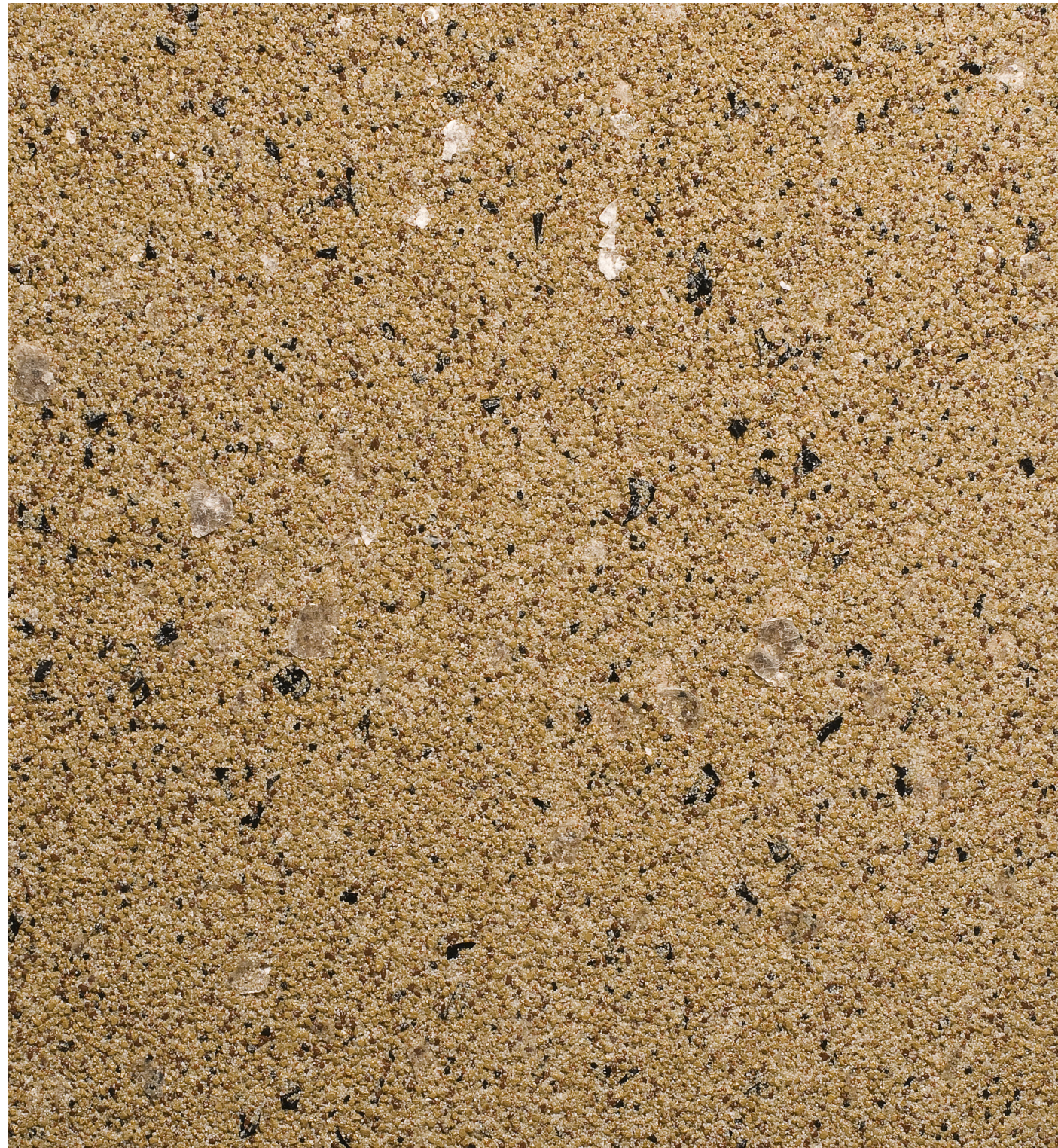
30201 Mojave 2012