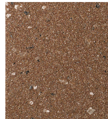
30205 Bryce 2012