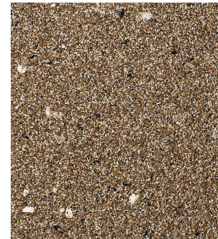
30207 Cheyenne 2012