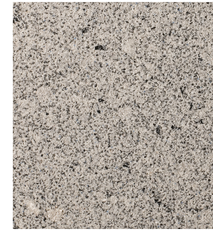
30209 Yosemite 2012